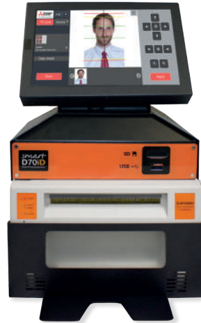
Sistema foto carnet Smart D70iD+